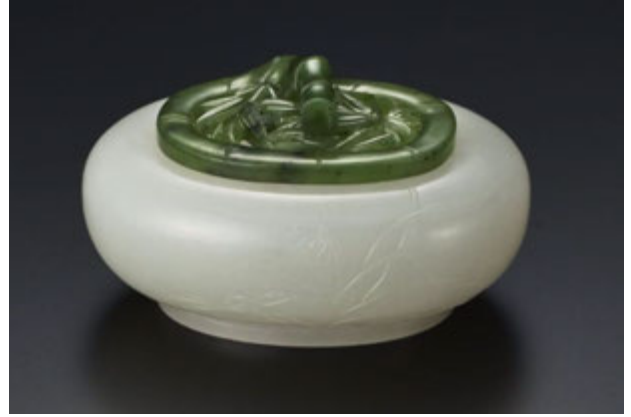
清乾隆 白玉蘭竹雙清翡翠蓋香薰爐 《乾隆年製》款 L:7.5cm; W:5.5cm; H:3.5cm (估價：15 萬至 25 萬港元)