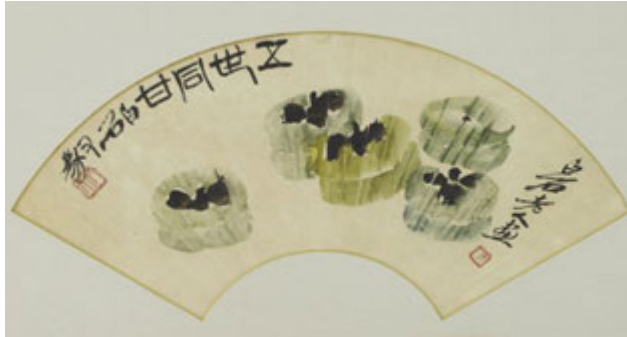
齊白石 (1863-1957) 《五世同甘扇面》 設色紙本 鏡框 扇面 20 x 56cm 約 1 平方

齊白石《五世同甘扇面》(估價：25 萬至 35 萬港元)，循雅淡超逸之筆，畫出質樸稚拙之氣，將五柿表現得靈動，且和在日本被奉為國寶的牧溪《六柿圖》構圖相似，隨機的擺設，用在每個果子上不同的筆墨、虛實、陰陽、粗細間的靈活運用，作品呈現出靜物作品的「隨處皆真」的境界，更似乎境外有意，當時極得東瀛藏家喜愛。