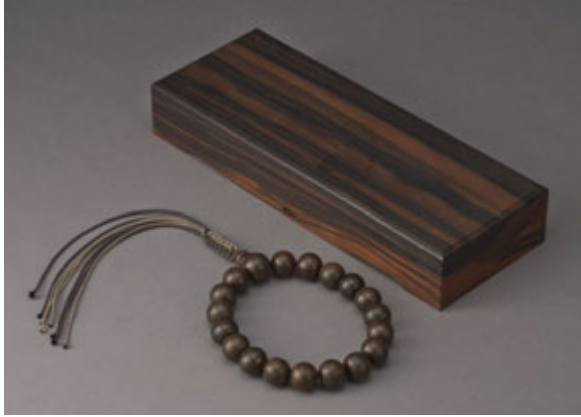
沉香手串 D:18cm; 重:94.5g; 19 顆 (估價：3 萬 5 千至 5 萬 5 千港元)

東京中央拍賣(香港)有限公司 Tokyo Chuo Auction (Hong Kong) Co.,Ltd.