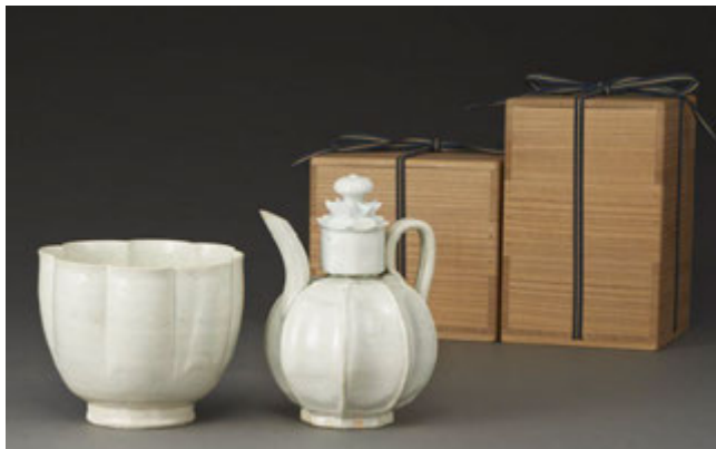
南宋 影青瓜棱執壺連溫碗

另一重要拍品為明隆慶剔紅雙龍戲珠紋碗《大明隆慶年製》款（估價：180 萬至 250 萬港元），碗內及足內髹紅漆，碗外壁飾雲龍紋，行龍舞動，瞪眼張口，五爪奮張，龍鬚發揚，姿態威武，龍身下方海浪起伏，極富動感，充滿氣勢而富麗。刀法俐落有力，刀痕鑿鑿，益顯行龍生命力，漆層薄而漆色潤，是宮廷雕漆巔峰之作。