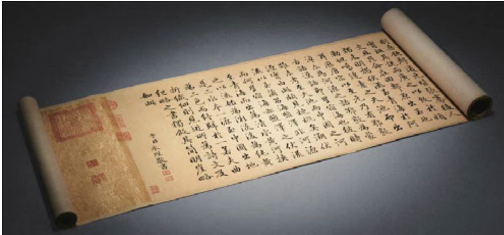
清成親王(1752-1823)《御製河源簡明語卷》水墨紙本 手卷 29.5 × 115cm 約 3.1 平尺

清宮舊藏瑰寶、石渠寶笈二編著錄： 清成親王《御製河源簡明語卷》 首次在拍賣市場上推出